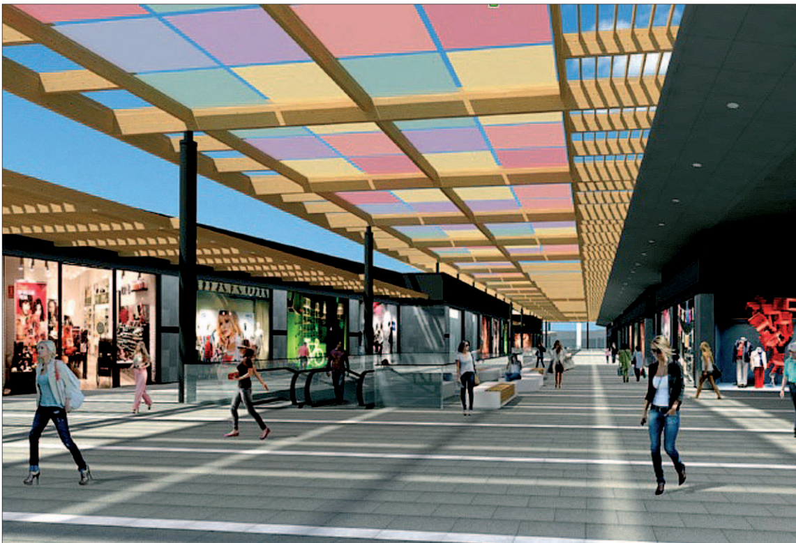
Recreación virtual del proyecto de mejora de la pérgola del centro comercial Imaginalia.