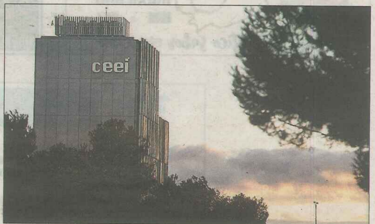
El encuentro se desarrollará en el Centro Europeo de Empresas.

Todos ellos abrirán debate sobre el estado de la música electrónica actual, sirviéndose de ponencias, debates y charlas, incidiendo en la profesionalización del sector y otros asuntos.