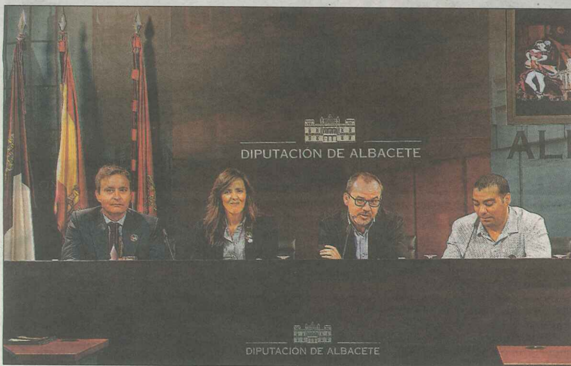
Rueda de prensa de presentación de las Jornadas de la Cultura Cubana.