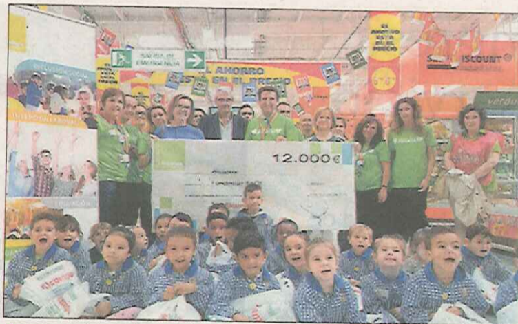
Un instante del acto que tuvo lugar en Alcampo Albacete.

Además del importe económico, el hipermercado de Albacete colaborará activamente en el desarrollo del proyecto de Fundación