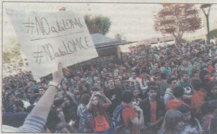
Imagen de una concentración en una huelga educativa anterior.

Entre los planteamientos que llevan a este paro en Educación, alumnos y profesores piden «un